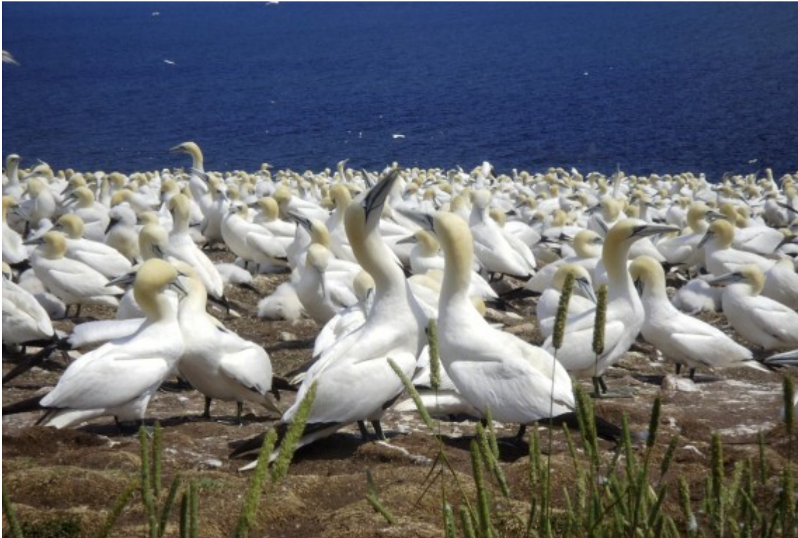
Die größte Basstölpel-Population Amerikas findet sich auf der Insel Bonaventure.

Aber ein Urlaub in Percé bietet noch viel mehr. Fahrten mit dem Seekajak, eine Hummerfangexkursion mit einem phantastischen Seafood-Essen, wer möchte sich das entgehen lassen? Sporttauchen im Meer vor der Hafenstadt? Kein Problem, ob allein oder mit einem Tauchguide, es wird spannend. Im Sommer Baden, oder am Strand nach Achat und Jaspis suchen. Vielfältige Aktivitäten sind im Osten Québecs möglich.