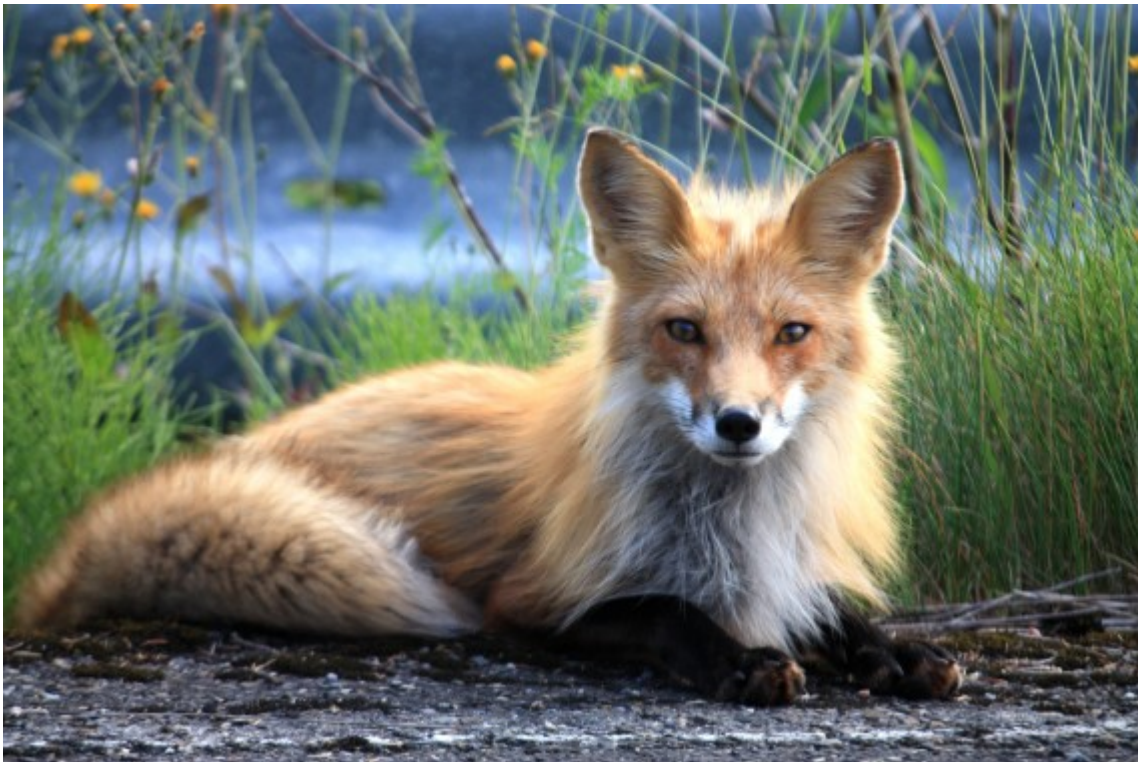
Natur pur in Percé auf der Gaspesie-Halbinsel.

Aber ein Urlaub in Percé bietet noch viel mehr. Fahrten mit dem Seekajak, eine Hummerfangexkursion mit einem phantastischen Seafood-Essen, wer möchte sich das entgehen lassen? Sporttauchen im Meer vor der Hafenstadt? Kein Problem, ob allein oder mit einem Tauchguide, es wird spannend. Im Sommer Baden, oder am Strand nach Achat und Jaspis suchen. Vielfältige Aktivitäten sind im Osten Québecs möglich.