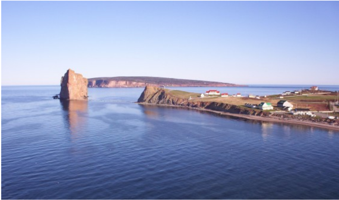
Perce, aus der Luft gesehen.