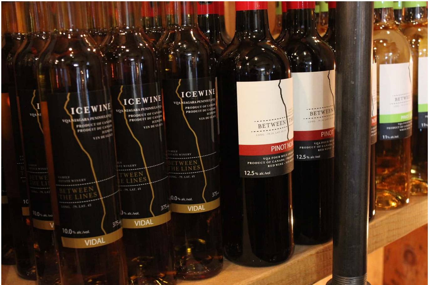
In den Weinbauregionen Kanadas werden tolle Weine an- und ausgebaut.