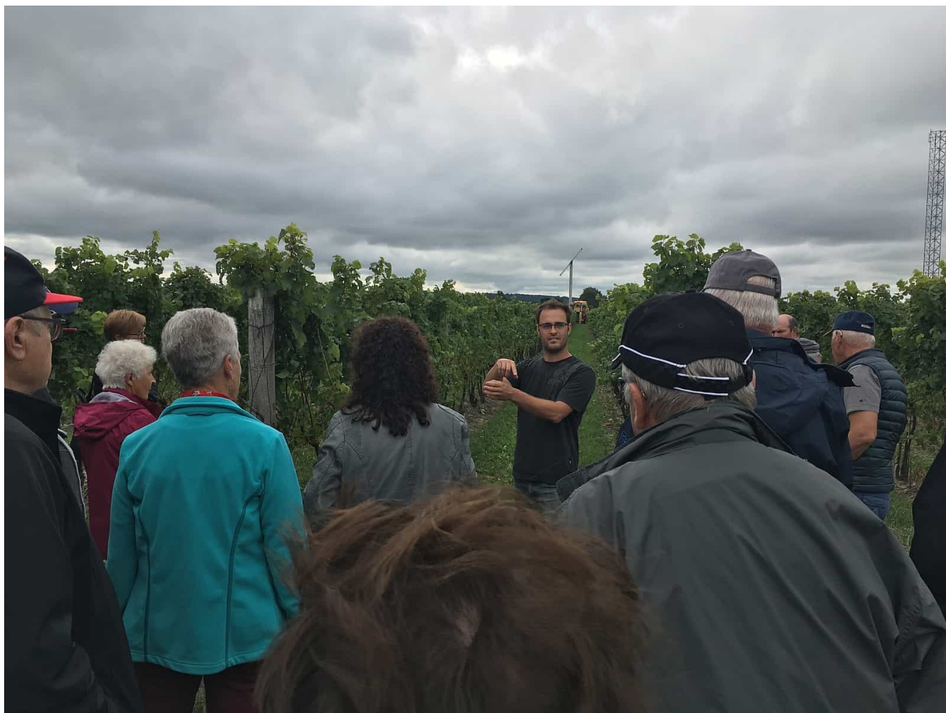
Im Vineyard erfahren Besucher Wissenswertes über den Weinbau in Kanada.