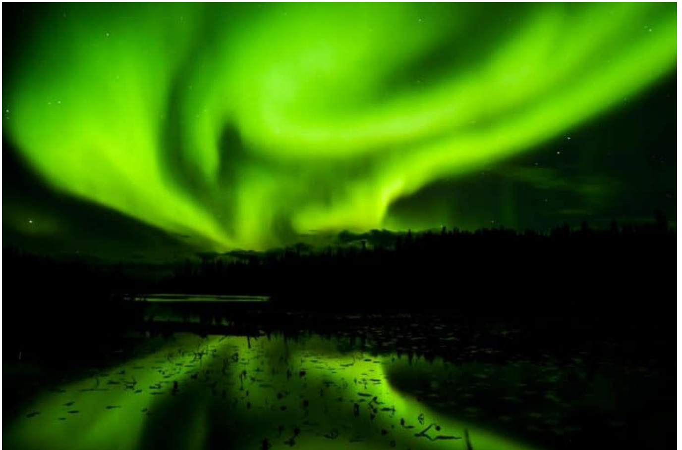
Yellowknife - Hauptstadt der Aurora Borealis