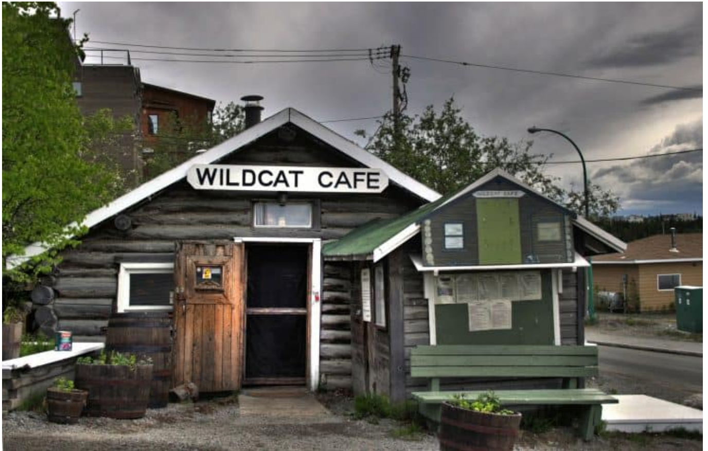
Yellowknife - Wildcat Cafe