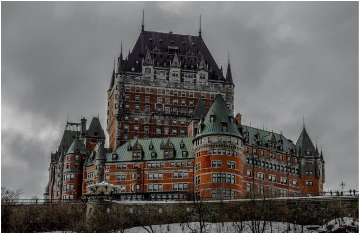
Québec City - Château Frontenac