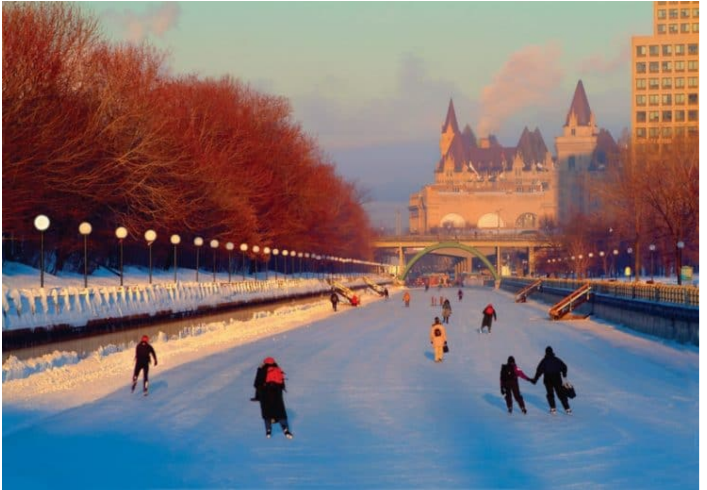
Rideau Canal National Historic Site, Ottawa, Ontario, Winterimpression