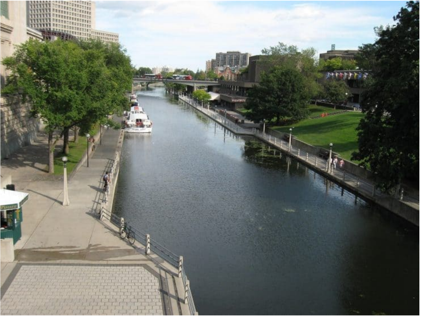
Rideau Canal National Historic Site, Ottawa, Ontario -1