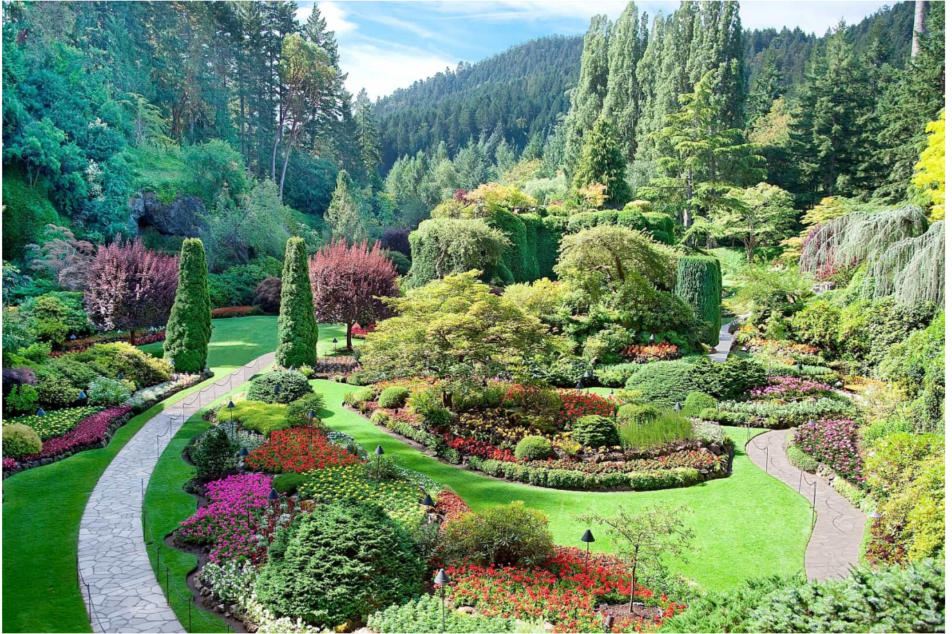
A view of the sunken garden at Butchart Gardens, Central Saanich, Vancouver Island, British Columbia, Canada

Ein Erlebnis der besonderen Art ist ein Spaziergang durch Butchart Gardens auf der Saanich Halbinsel. Mit einem Meer aus Farben entführt dieser über 100 Jahre alte Familiengarten seine Besucher in eine andere Welt. Jennie Butchart hatte 1904 die Idee zu diesem Projekt, um einen stillgelegten Steinbruch zu verschönern. Wo einst Kalkstein abgebaut wurde blühen heute Rosen und locken japanische und mediterrane Gärten zu einem Spaziergang. Der 22 Hektar große Park ist immer noch im Besitz der Familie Butchart und zählt zu den schönsten Gärten Kanadas.