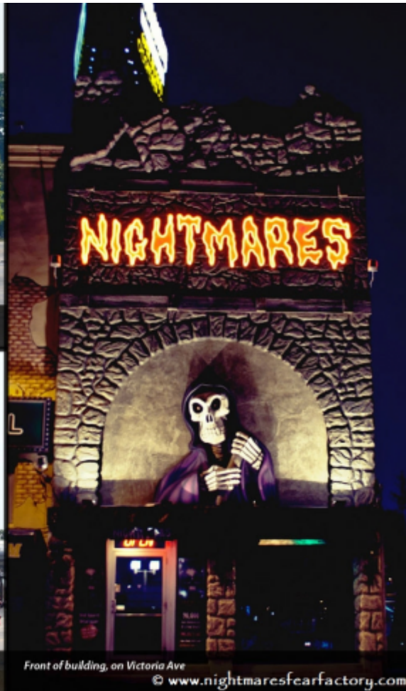
Front of building, on Victoria Ave