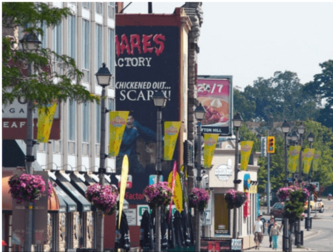
From the Top of Clifton Hill, looking North East, down Victoria Ave, towards the Days Inn and Applebee's Restaurant