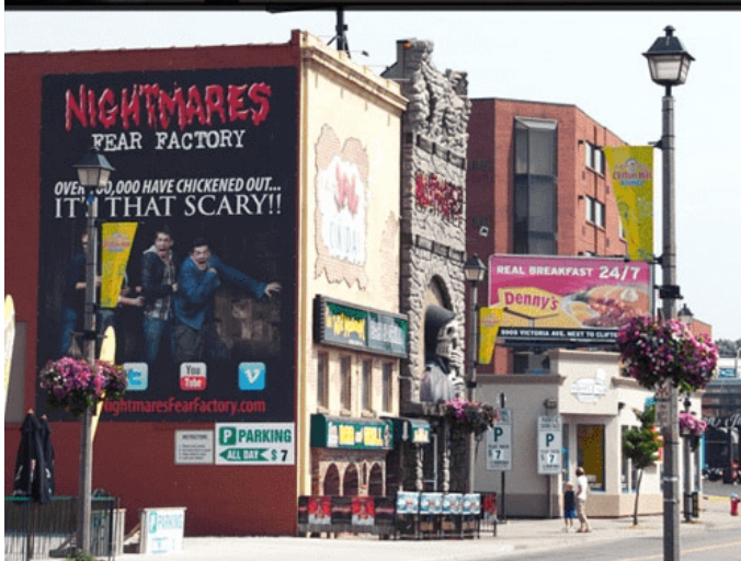
On Victoria Ave, standing across from the Days Inn and Applebee's Restaurant