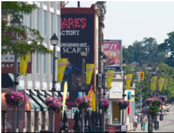
From the Top of Clifton Hill, looking North East, down Victoria Ave, towards the Days Inn and Applebee's Restaurant