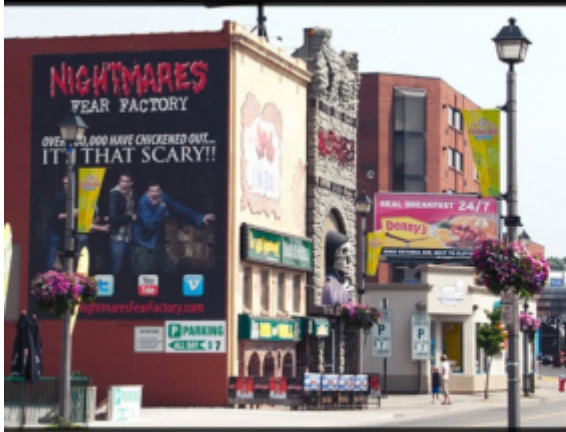
On Victoria Ave, standing across from the Days Inn and Applebee's Restaurant