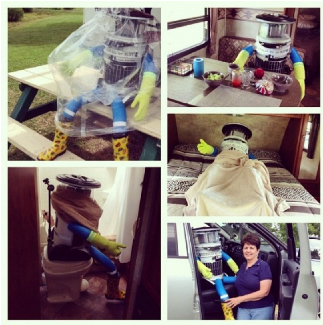
hitchBOT's Reiseimpressionen.