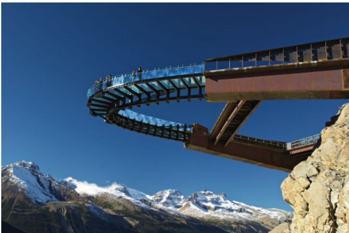
Glacier Skywalk - From Below