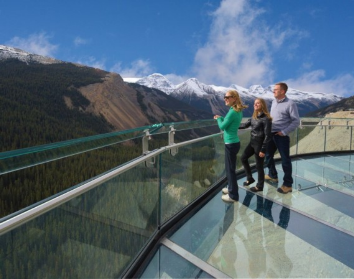
Glacier Skywalk