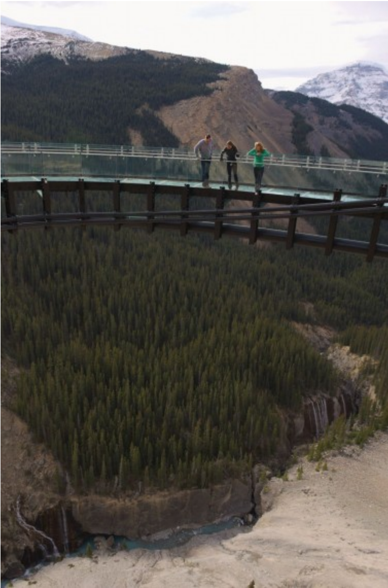
Glacier Skywalk - Looking Down - (c)glacierskywalk