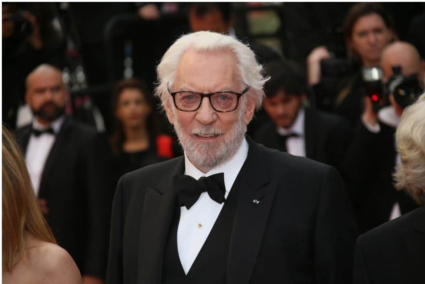
Schauspieler Donald Sutherland bei den Filmfestspielen in Cannes im Jahr 2016.

Donald McNicol Sutherland wurde am 17. Juli 1935 in Saint John, New Brunswick geboren. Der markante Schauspieler gehört sicher zur Garde der weltbesten seines Berufstandes. Schon früh wurde das schauspielerische Talent Sutherlands erkannt, das Theaterspiel war der Grundstein und ist bis heute sein großes Steckenpferd geblieben. Nach einigen Jahren, in denen er in kleineren Werken und auf Theaterbühnen spielte gelang ihm mit den Serienauftritten in „Simon Templar“ und „Mit Schirm, Charme und Melone“ sowie den Filmklassikern „Das dreckige Dutzend“ und „MASH“ der an der Seite von großen Stars der internationale Durchbruch. Für sein herausragendes Lebenswerk wurde Donald Sutherland im Jahr 2017 der Ehrenoscar zuerkannt. Neben dem herausragenden Genre-Werk „Wenn die Gondeln Trauer tragen (1973)“ spielte Sutherland unter anderem in diesen Klassikern: Klute (1971), Der Richter und sein Henker (1975), Der Adler ist gelandet (1976), Der große Eisenbahnraub (1979), Die Nadel (1981), Lock Up - Überleben ist alles (1981), JFK - Tatort Dallas (1991), Space Cowboys (2000), The Italian Job - Jagd auf Millionen (2003), Unterwegs nach Cold Mountain (2003), Der Adler der neunten Legion (2011), Die Tribute von Panem (2012, 2013, 2014, 2015) und Ad Astra - Zu den Sternen (2019).