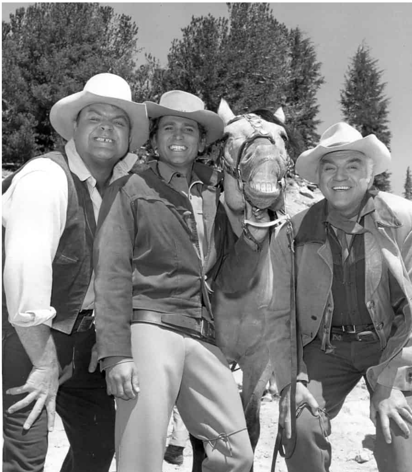
Lorne Greene in seiner Paraderolle des Ben Cartwright (rechts) in der Fernsehserie Bonanza, gemeinsam mit seinen Filmsöhnen (von links) Dan Blocker (Hoss), Michael Landon (Little Joe) sowie Ben's Pferd Buck im Jahr 1968.

Lorne Greene, eigentlich Lyon Himan Green wurde am 12. Februar 1915 in Ottawa geboren. Er ging als wahrscheinlich berühmtester Vater in die Filmgeschichte ein, als er die Rolle des Benjamin „Ben“ Cartwright in der Fernsehserie „Bonanza“ übernahm, der mit seinen drei Söhnen Adam, Hoss und Little Joe die Farm Ponderosa leitete und dabei manches Abenteuer erlebte. Seine Karriere als Schauspieler begann Greene schon während seines Studiums. Allerdings wurde er zunächst in Kanada durch seine markante, sonore Stimme als Chef-Nachrichtensprecher bei Radio CBC