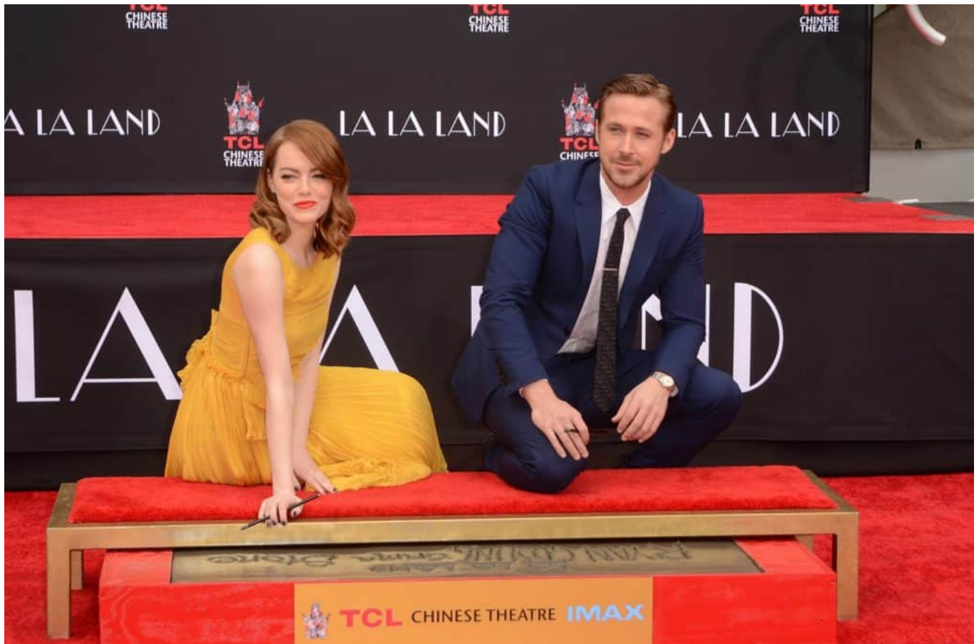
Ryan Gosling mit Emma Stone bei der Hand and Foot Print Ceremony am TCL Chinese Theater in Hollywood im Jahr 2016.

Der kanadische Schauspieler Ryan Thomas Gosling wurde am 12. November 1980 in London, Ontario geboren. Seine ersten schauspielerische und künstlerische Schritte machte Gosling gemeinsam mit Britney Spears, Christina Aguilera und Justin Timberlake im Mickey Mouse Club. Mit mehreren international beachteten Filmen arbeitete sich Ryan Gosling in die erste Liga der Schauspieler hoch. Seine begeisternde Darstellung des Pianisten Sebastian im Filmmusical „La La Land“ brachte ihm 2017 einen Golden Globe Award und eine Oscar-Nominierung ein. 2018 spielte er die Hauptrolle im Film „Aufbruch zum Mond“, der die Geschichte des Testpiloten und Astronauten Neil Armstrong und seinen Weg als erster Mann auf dem Mond zeigt. Weitere bekannte Filme mit Ryan Gosling sind: Gegen jede Regel (2000), Half Nelson (2006), All Beauty Must Die (2010), The Place Beyond the Pines (2012) und Blade Runner 2049 (2017).