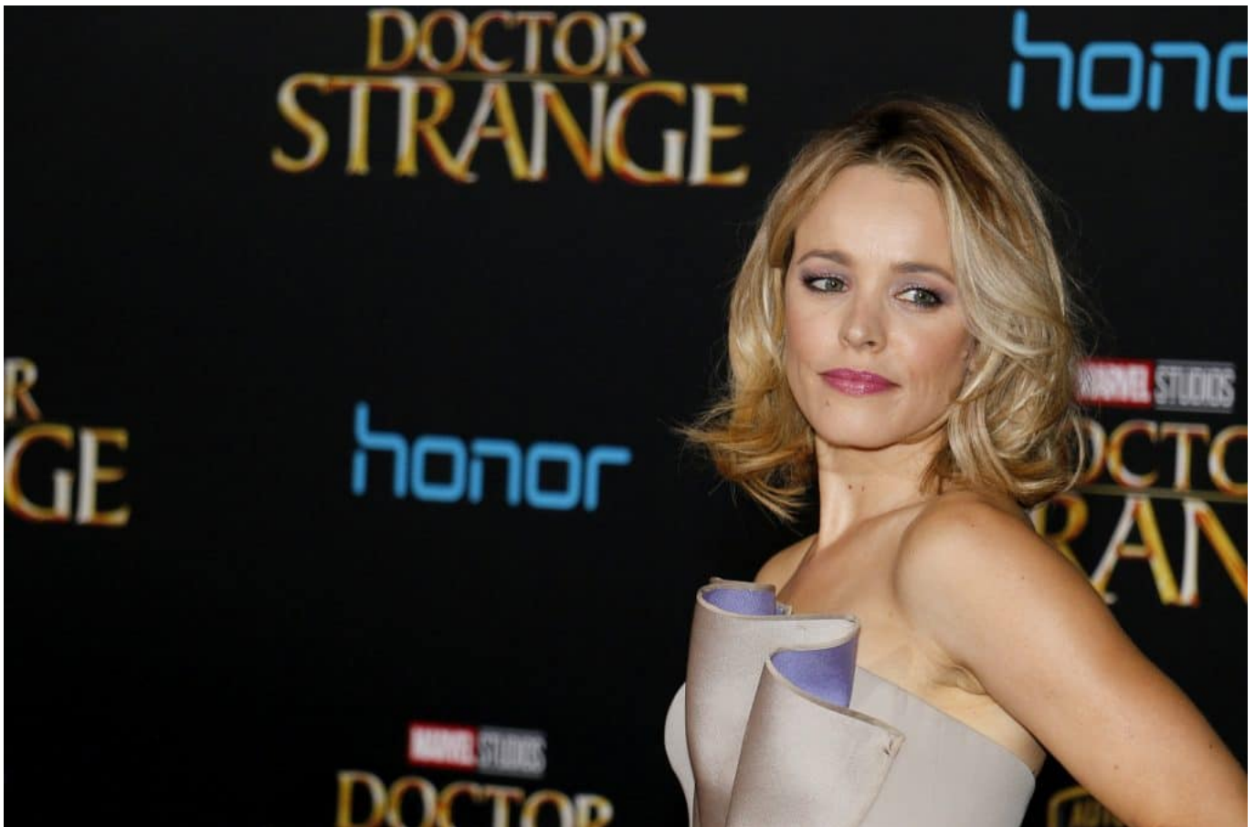
Rachel McAdams bei der Weltpremiere des Kinofilmes Doctor Strange im Jahr 2016 am El Capitan Theatre in Hollywood.

Die am 17. November 1978 in London, Ontario geborene Rachel Anne McAdams begann schon im