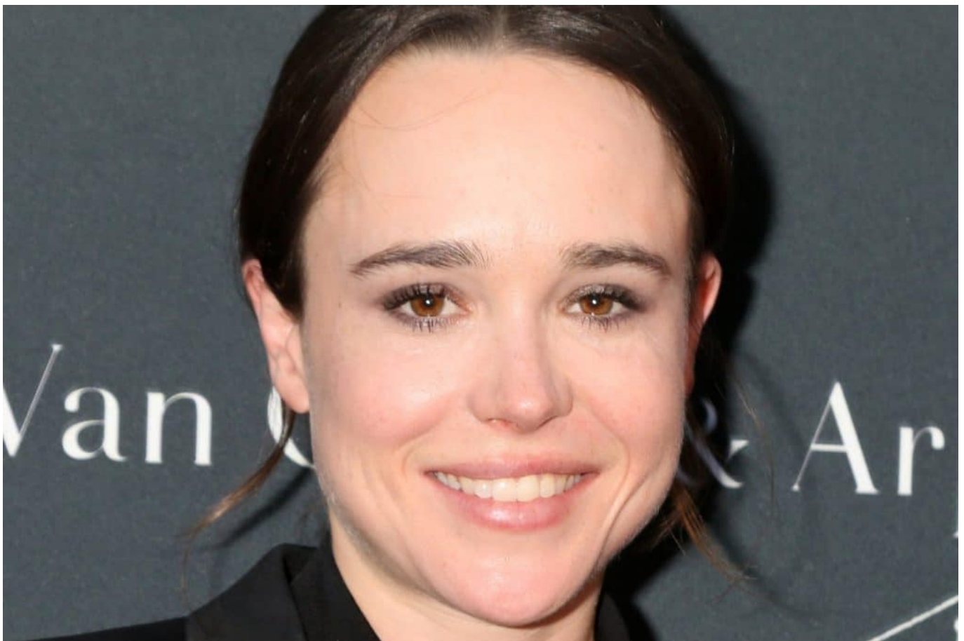
Ellen Page bei der Los Angeles Dance Project Gala im Jahr 2017.

Ellen Grace Philpotts-Page wurde am 21. Februar 1987 in Halifax, Nova Scotia geboren. Bereits mit zehn Jahren begeisterte sie sich für die Schauspielerei, hatte in diesem Alter die erste große Rolle im Pilotfilm zur kanadischen Serie „Pit Pony – Wenn der Mond zur Sonne wird“. Letzendlich war es der Blockbuster „X-Men: Der letzte Widerstand“, der ihr im Jahr 2006 den internationalen Durchbruch brachte.