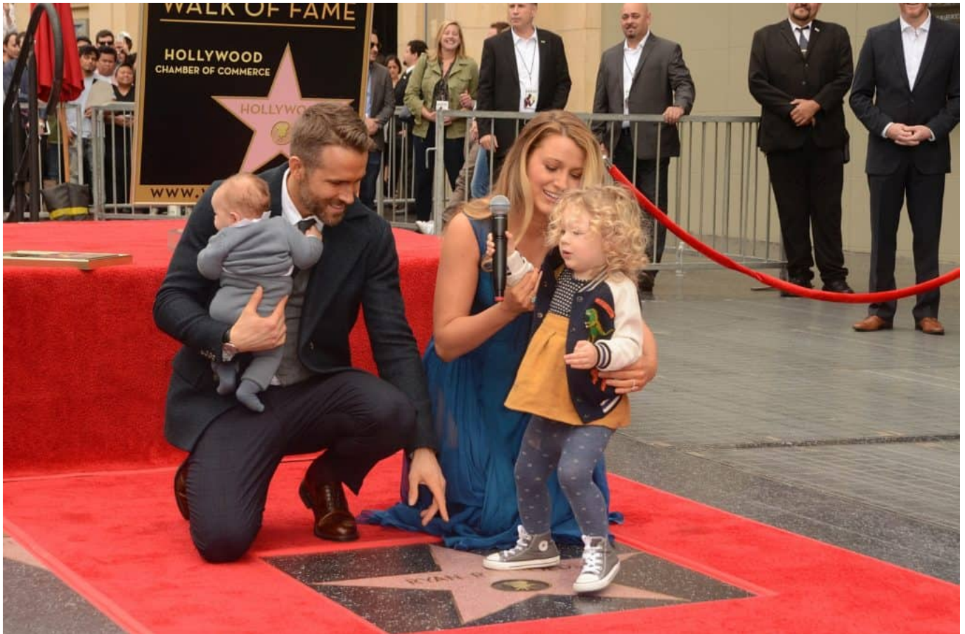
Ryan Reynolds mit Familie bei der Hollywood Walk of Fame Ceremony in Hollywood im Jahr 2016.

Geboren am 23. Oktober 1976 in Vancouver als Ryan Rodney Reynolds kam der Schauspieler schon früh mit dem Filmgeschäft in Kontakt. Bereits mit 15 Jahren spielte er ab 1991 in der Nickelodeon-Serie Hillside mit und wurde für einen Youth in Film Award nominiert. In Los Angeles angekommen, wurde er schnell für große Filmprojekte entdeckt, so 2004 an der Seite von Wesley Snipes in „Blade: Trinity“. Weitere weltbekannte Filme mit Reynolds sind unter anderem Amityville Horror - Eine wahre Geschichte (2005), X-Men Origins: Wolverine (2009), Green Lantern (2011), R.I.P.D.(2013), Deadpool(2016), Deadpool 2(2018) und Fast & Furious: Hobbs & Shaw (2019).